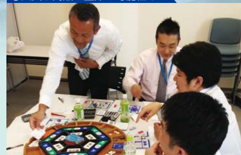
③火災や商品の盗難の可能性も