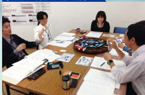
②生産した商品を入札で販売