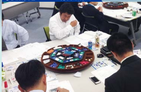
①製品製造のための材料を購入